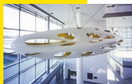
Movement No.2 -cirrus radiatus- 2005 AIIA Building