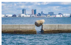
間のかたち/inbetween form 2009 神戸ビエンナーレ2009 神戸港