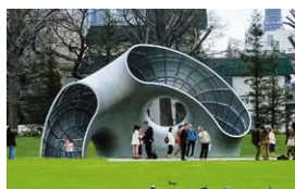
Fragment No.5 -caverna lunaris- 2006 東京ミッドタウン