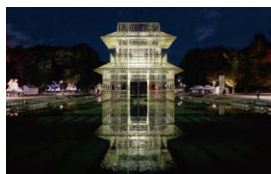
プラネテス -私が生きたようにそれらも生き、 私がいなくなったようにそれらもなくなった- TOKYO 数寄フェス2017