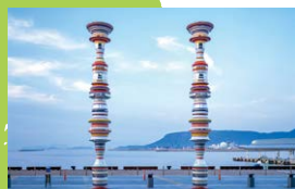
Liminal Air-core- 神戸国際芸術祭2010