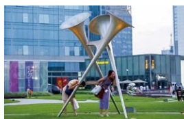
Soundscape I 2014 IFS 彫刻公園