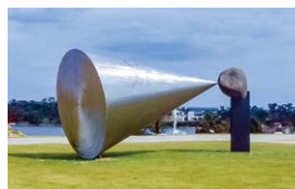
呼吸するとき一瞬 第15回現代日本彫刻展 1993