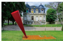
傾くかたち-赤 2014 Inclination Form- Red 2014 ムッセルパーク&メゾン、アンドレジー、フランス Parc & Maison du Moussel, Andresy, France