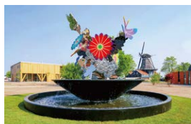
Immortal Flowers Rikka 2018 European Capital of Culture [11 Fountains] IJlst/オランダ