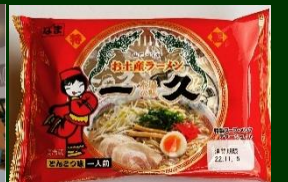
株式会社 一久食品