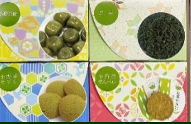
株式会社 山口茶業