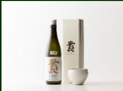
株式会社 永山本家酒造場