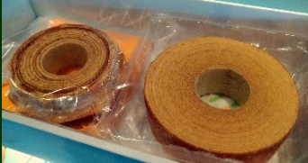
バウムクーヘン&ラ・クチーナ