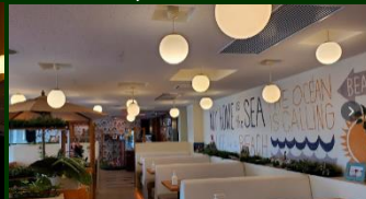
Hawaiian Resort Cafe Leola