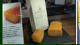
創作菓子のロイヤル