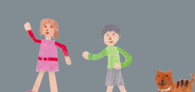
イラスト: 岡本よしろ