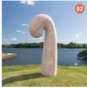
02 IMAGINE 藤井 浩一朗 【UBE株式会社賞】