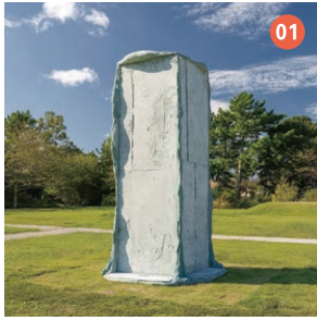
01 Press block 渡久地 佑弥 【大賞(宇部市賞)】