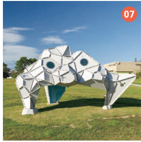
07 雨雲ヒュッテ 大西 治・大西 雅子 【山口県立美術館賞】