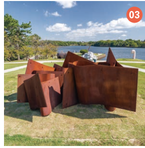
03 十二の物語 小笠原 伸行 【毎日新聞社賞】