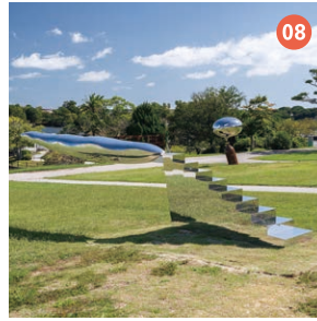
08 そのさきにあるもの 関 玄達 【島根県立石見美術館賞】