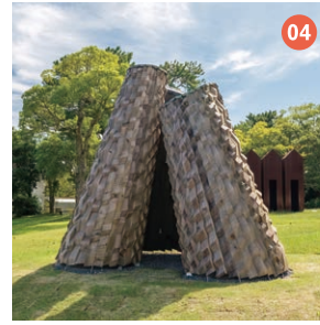
04 THE FOREST GOWN 石上 和弘 【山口銀行賞】