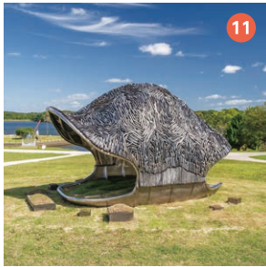
11 The Carapace Chatchawan AMSOMKID