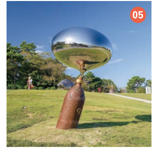
05 フリーエア HUANG Yu-Jung 【宇部商工会議所賞】