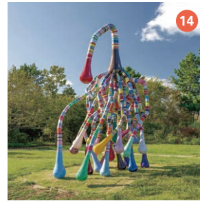
14 The Seed DAM Dang Lai