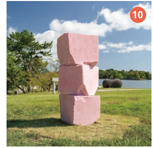
10 サクラの柱 袁 方洲