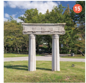
15 Yakumo-Lafcadio, Doric Torii Kousioglou-Stai