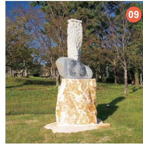
09 Hito_ita-k021 Jun.024 Kyuichi Sato 【柳原義達賞】