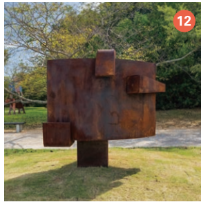
12 カノ女の父 松村 明育